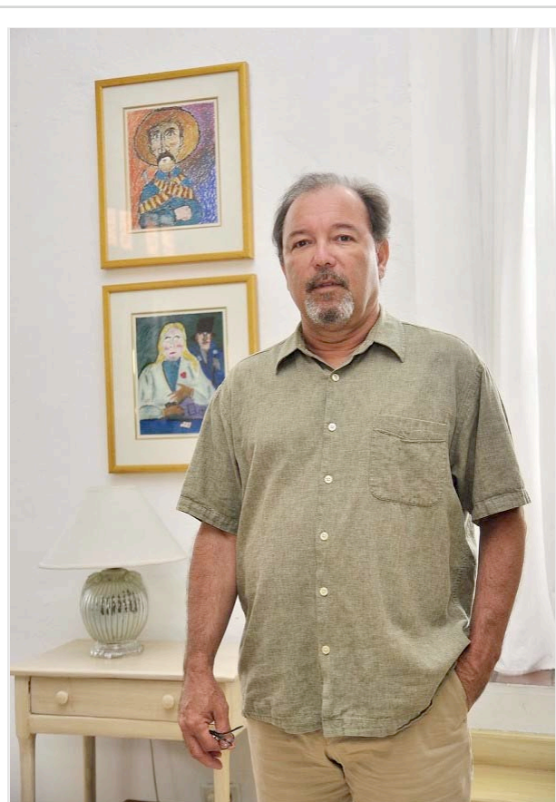
FACETA. Mucha gente desconoce que el músico también pinta.

El salsero considera que actualmente en muchos hogares panameños ha tenido ‘lugar una