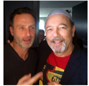
Andrew Lincoln, protagonista de 'The walking dead' y Rubén Blades, en la Comic Con de San Diego.

interesada en cambiar la constitución y las leyes. La gente quiere la tortilla, pero que no se rompan los huevos", dice. De momento le espera el posible éxito que Fear The Walking Dead le pueda proporcionar. Él está curado de espanto, pero igual le quitará más tiempo de acabar colecciones de cómics o de volver a la carretera a presentar su nueva música. Cualquier cosa será bienvenida para ser más sabio y seguir vivo.