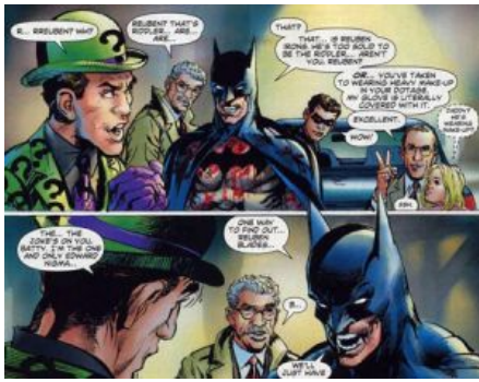
Las viñetas de Batman en el que el héroe cita el nombre de Rubén Blades.

una reinterpretación. A veces lo mezclo con lo que he escrito". "Sé más de lo que sé. Puede que conozca cosas que son totalmente inútiles, pero oye, ¡no me importa!", reconoce Blades.