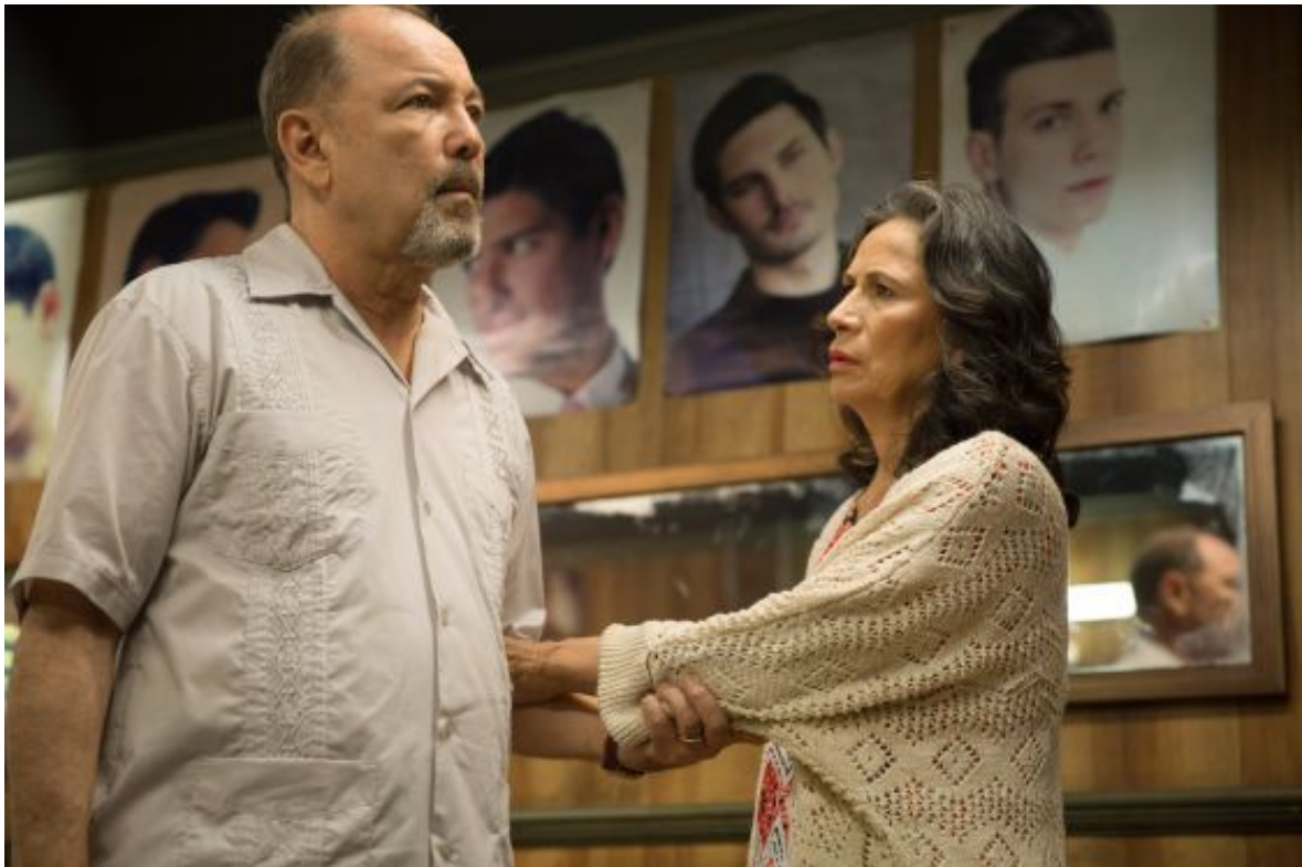
Rubén Blades y Patricia Reyes Spíndola en 'Fear the walking dead'.