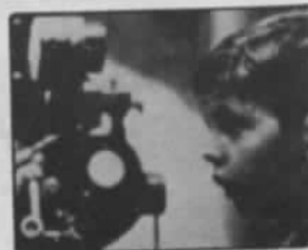
Cinema Paradiso, un extraordinario film de Giuseppe Tornatore