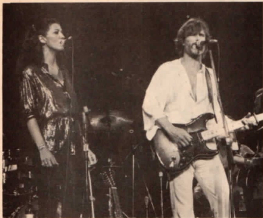
Rita Coolidge y su esposo Kris Kristofferson, muy aplaudidos por el público cubano.