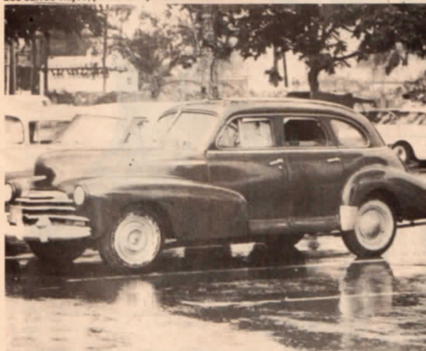
Los carros viejos, primera impresión cubana.

comparación con el recibimiento que le dieron a los grupos que anteriormente mencioné. Pero antes déjame señalarte que el grupo de la Fania fue programado para actuar de último y tarde en la noche y mucha gente tuvo que irse. El público que asistió fue preseleccionado, (invitados selectivamente). A la gente que posiblemente le hubiera gustado la Fania All Stars no pudo asistir. El